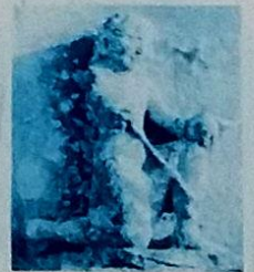
Le tireur d'épée

■ En ruine en 1587, abandonnée un temps, l'église est restaurée au XVII ème siècle : les murs gouterreaux de la nef, repris, sont pourvus de contreforts plus épais et la nef de nouveau lambrissée. L'abside et le transept, raidis de nouveaux contreforts, reçoivent des voûtes d'ogives. Au XVIII ème siècle, une sacristie jouxte le chevet.