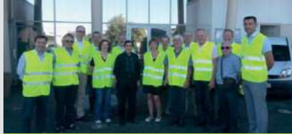
Elu-e-s d'Alsace Juillet 2015