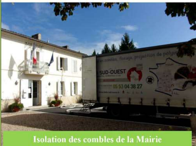
Isolation des combles de la Mairie