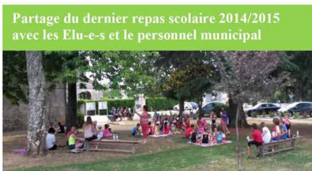
Partage du dernier repas scolaire 2014/2015 avec les Elu-e-s et le personnel municipal