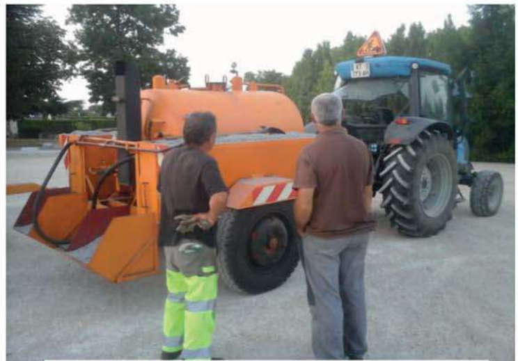
Entretien de la voirie communale : Point-à-temps