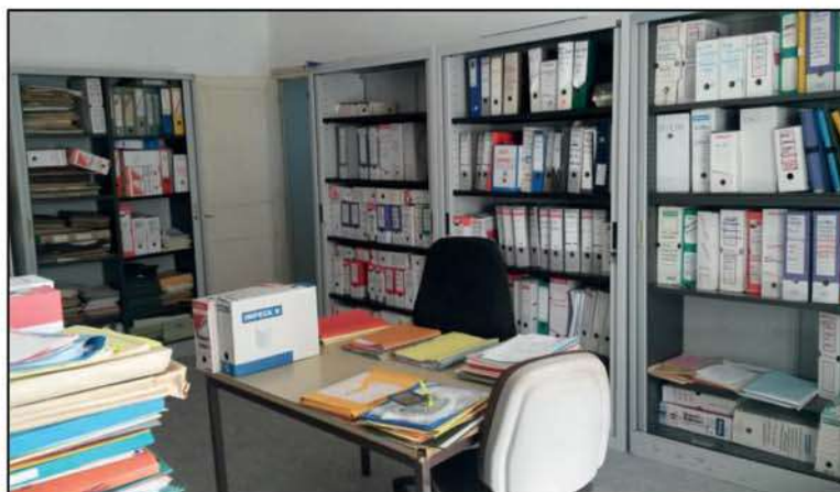
Création d'une salle des archives : 1 er étage de la Mairie

Les archives communales constituent la mémoire de la commune. Leur conservation garantit la bonne gestion administrative de la commune, en particulier pour justifier ses droits. Elles permettent aussi de retracer son histoire dans des articles, des publications, des expositions ou via Internet et participent à la création du lien social au sein de la collectivité.