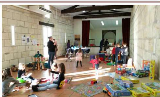
Portraits de familles : Après-midi jeux Octobre 2015