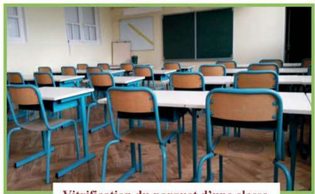
Vitrification du parquet d'une classe