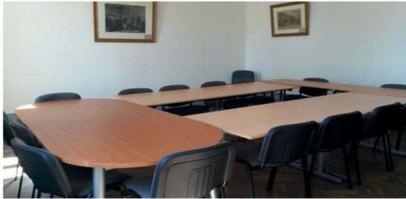
Nouvel ameublement de la salle du Conseil