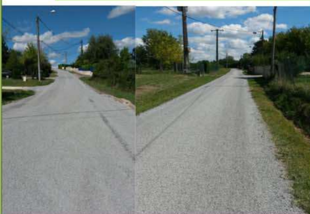
VC 123 dite du Sillat VC 114 bis dite de Cheminade