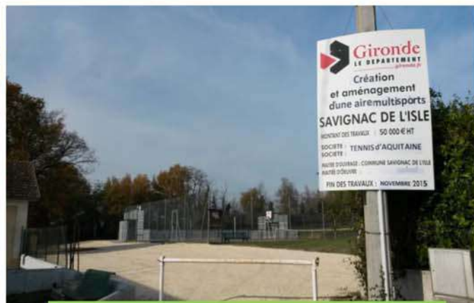
Aménagement accès tennis et multisports