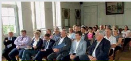
Maires Pays de Guîtres Juin 2015