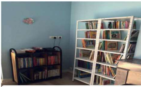
L'école : Aménagement d'un coin bibliothèque