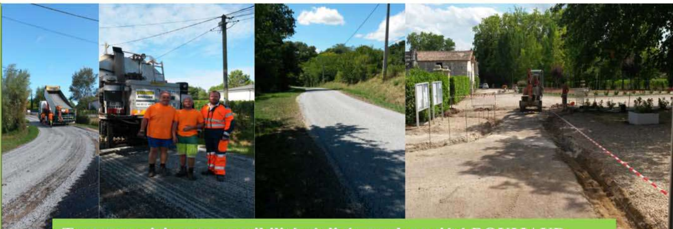
Travaux voiries et accessibilité réalisés par la société BOUIJAUD