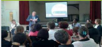
CALI : bilan des parcours éducatifs et culturels Juin 2015