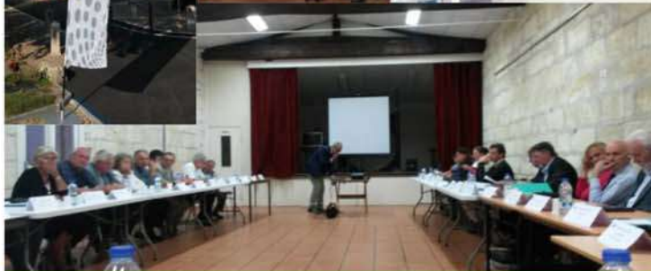
CALI: réunion des 34 Maires septembre 2015