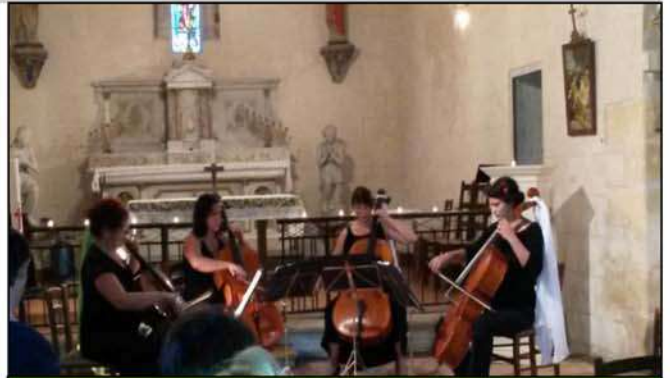
Concert du quatuor ANIMA dans l'église St Félix