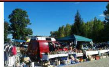
Gros succès au vide grenier

Savignac en Fête s'est réuni en Assemblée Générale extraordinaire et ordinaire le 14 novembre 2015.