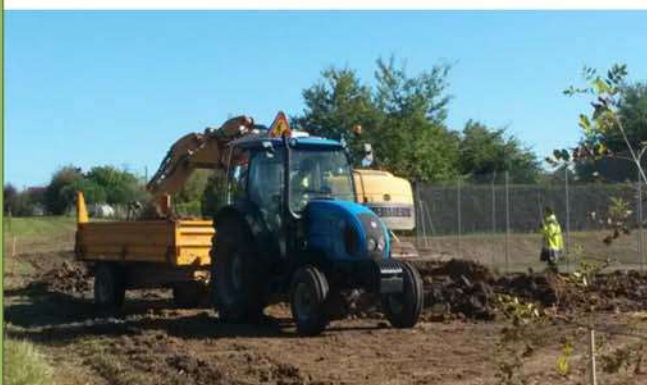
Travaux : Aire multisports