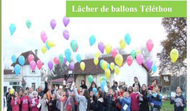
Lâcher de ballons Téléthon