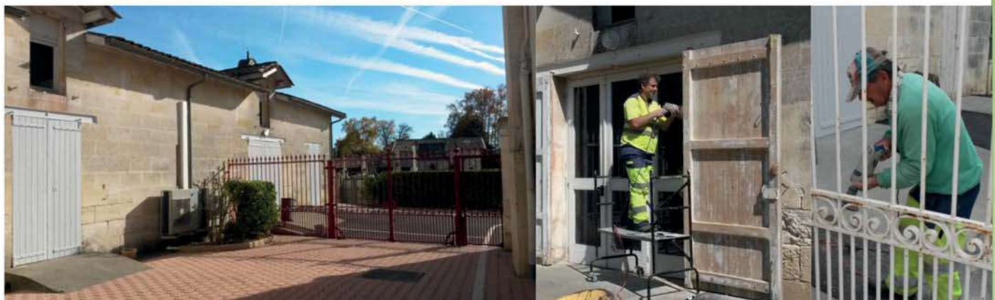
Rénovation et entretien du patrimoine : début des travaux de restauration et de peinture