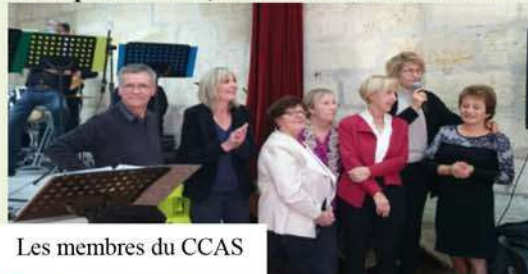
Les membres du CCAS

Des pâtisseries, des boissons chaudes et des rafraîchissements ont été offerts par la municipalité.