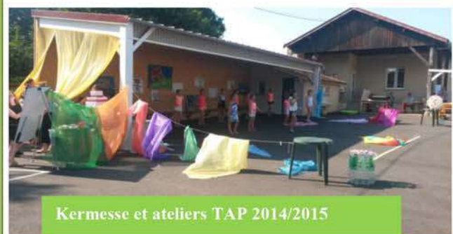
Kermesse et ateliers TAP 2014/2015