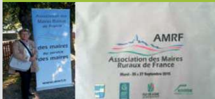
Congrès National AMRF septembre 2015