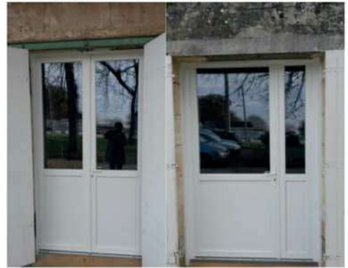
Nouvelles portes-fenêtres double vitrage Mairie