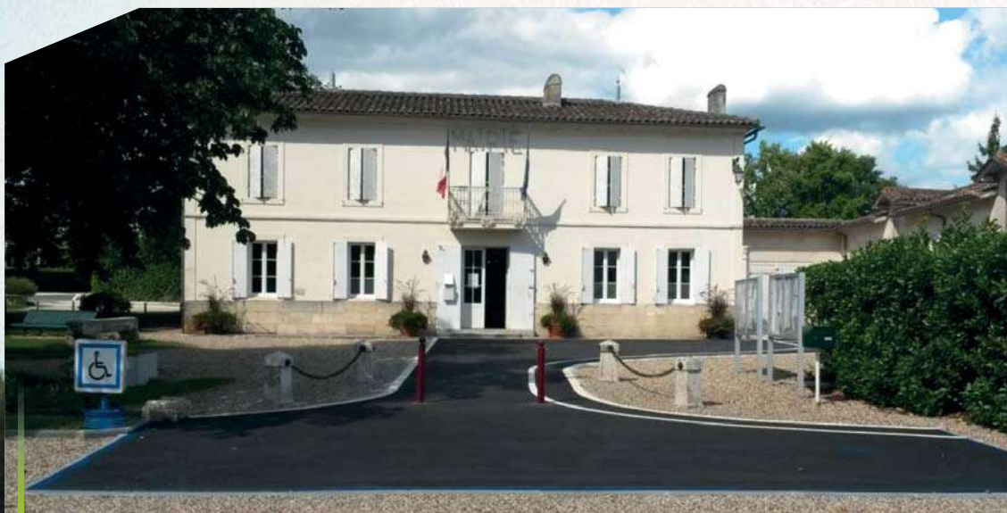
Nouvel aménagement l'accessibilité de la Mairie et de la salle des Fêtes