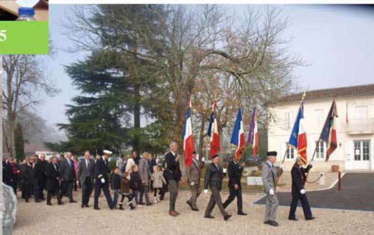
Cérémonie du 11 novembre 2015