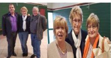
AG AMRF33 novembre 2017