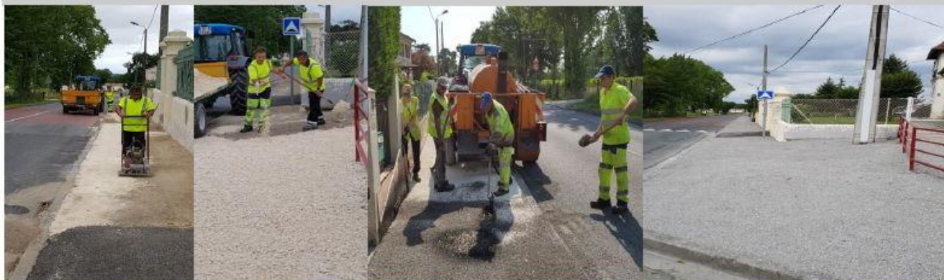
VOIRIES Réfection des trottoirs : meilleure accessibilité et sécurité