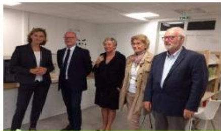
Collège Guîtres septembre 2017