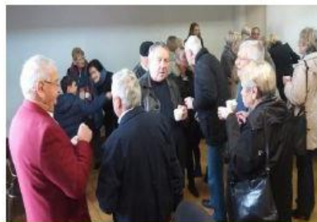
Post cérémonie le café gourmand