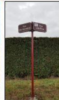
Nouvelle signalétique noms de rue, route, village

La pose de ces panneaux a pour raison principale de permettre aux secours, livraisons ou autres de mieux se repérer.