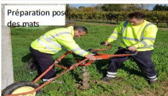
Préparation pose des mats