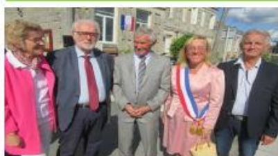
Bayas septembre 2017