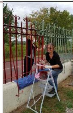
Rénovation du mur, des grilles et des portails de l'école et de la garderie