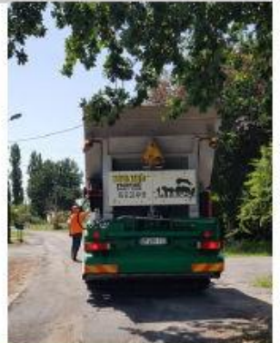
VOIRIES : réfection des Voies Communales n° 6, 111 et 116