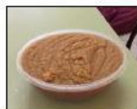
Semaine du goût