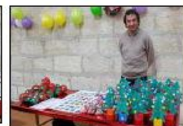
Marché de Noël organisé par l'amicale des Parents d'Elèves