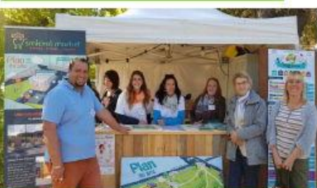
Festival ZZ octobre 2017