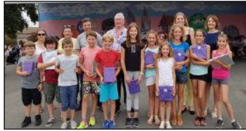
Remise de livres aux futurs collégiens