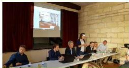
CALI Transports septembre 2017