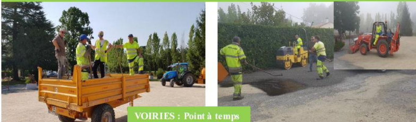
VOIRIES : Point à temps